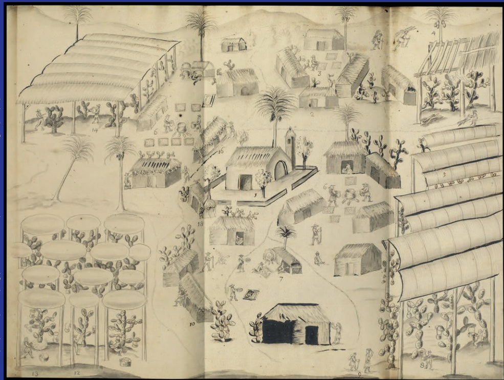
Pueblo granero de Guaxpaltepec, 1730.