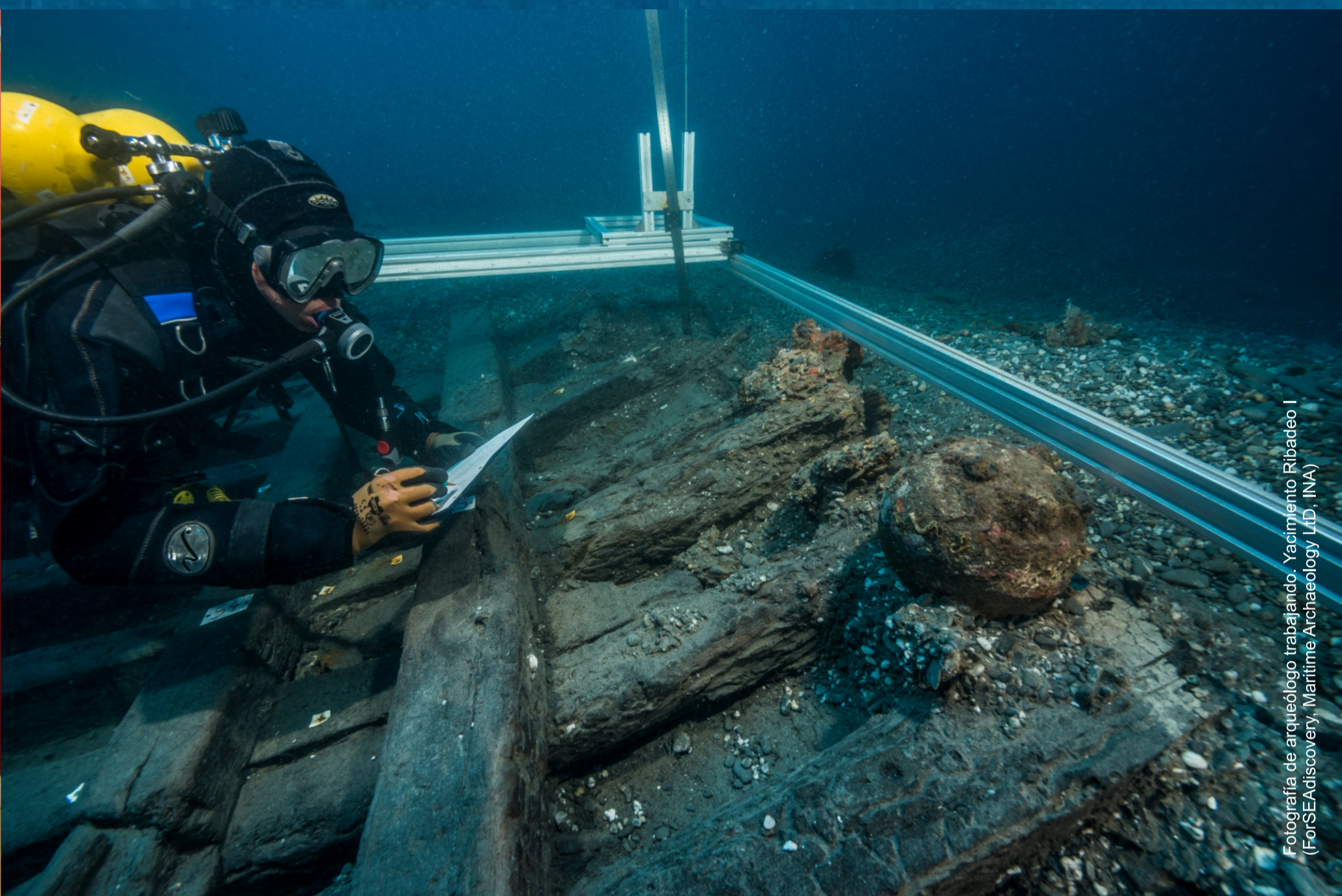
Fotografía de arqueólogo trabajando. Yacimiento Ribadeo I (ForSEAdiscover, Maritime Archaeology Ltd, INA)

Museo de América, Avenida de los Reyes Católicos 6, 28040 Madrid.